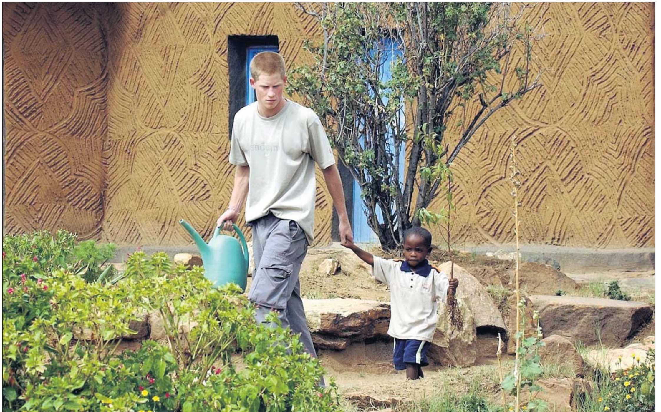
Einsatz für andere Menschen bringen dem britischen Prinzen Harry und der Sängerin Yvonne Catterfield (kl. Foto) Sympathien, für weniger prominente Zeitgenossen ist solches Engagement mitunter die Eintrittskarte in den Job