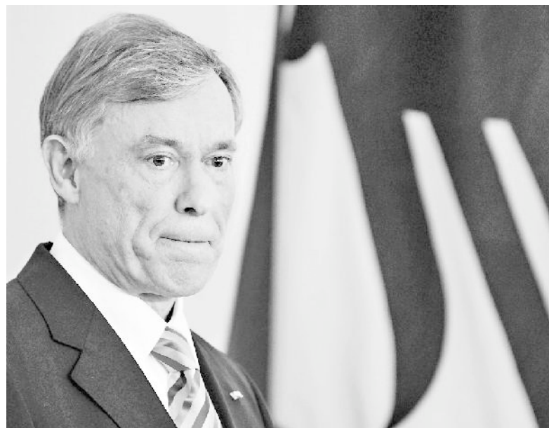
Bundespräsident Horst Köhler: Er hat in der Öffentlichkeit als einer der ersten den Anstoß zum heutigen Investivlohn-Konzept gegeben.

Angesichts des lang erwarteten wirtschaftlichen Aufschwungs hat die Politik vor zwei Jahren zu Recht darauf hingewiesen, dass nun die Chance auch für breitere Schichten der Bevölkerung besteht, durch die Beteiligung am eigenen Unternehmen