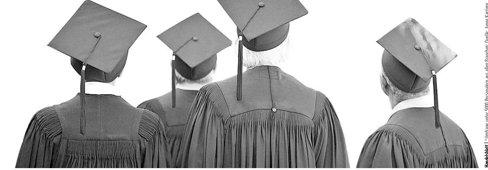
Handelsblatt | *Umfrage unter 5000 Personalern aus allen Branchen; Quelle: Junge Karriere